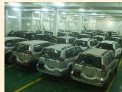
Pol : Alexandrie Pod : Anvers 193 véhicules – 2 expéditions