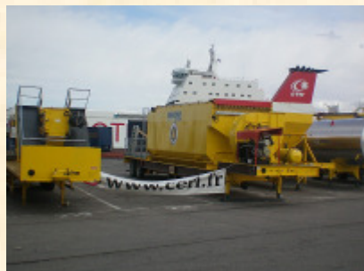
Pol : Marseille Pod : Tunis 9 unités – 1330 M3 – 131 T