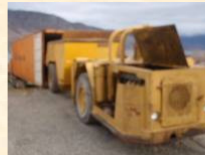
Pol : Montreal Pod : Fos sur Mer 1 x 40 High Cube