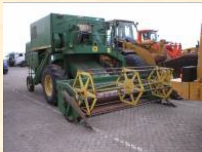
Pol : Anvers Pod : Djibouti 4 véhicules agricoles