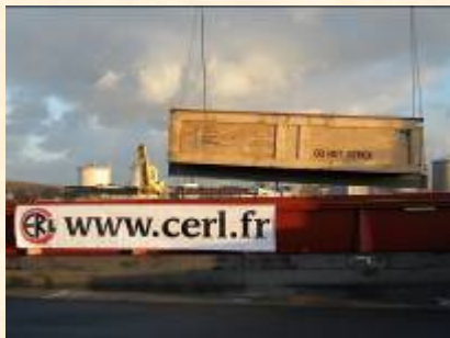
CFR SINGAPORE 7 Caisses – 6.12 x 6.10 x 1.54 M