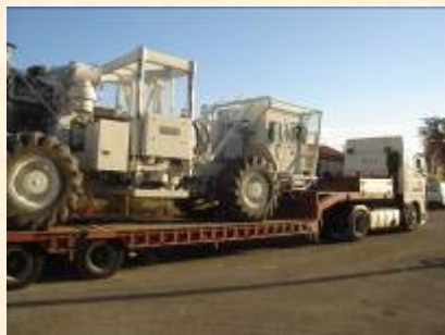
Transport France 5 vibrateurs