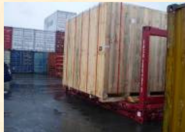
Cross Trade BUSAN > LONG BEACH