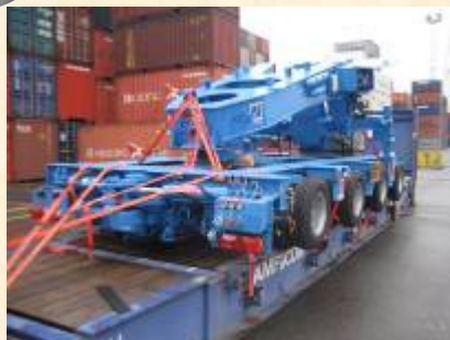
Pol : Anvers Pod : Itaguai / Sepetiba – Brésil 4 x 40 Flat Rack