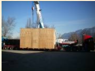
CFR JEDDAH 2 X 40 FR + 1 x 40 OT