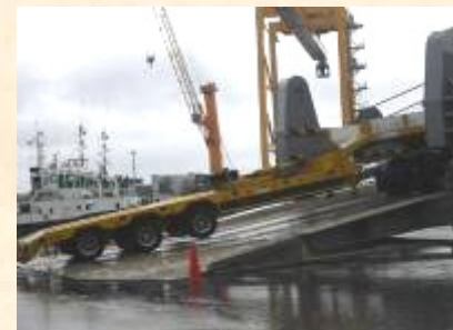
Pol : Pointe des Galets Pod : Le Havre 12.40 x 2.54 x 2.67 M – 12.3 T