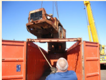
Pol : Freemantle Pod : Fos sur Mer 2 x 40 Open Top

Navire roulier Container flat rack Container open top Container dry Mafi