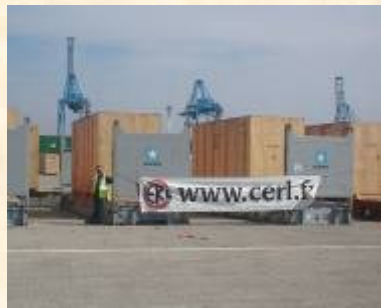
CFR VISAKAHAPATNAM 12 x 40 Flat Rack OOG